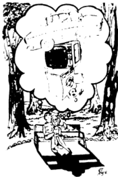
VIVIR DE SUEÑOS