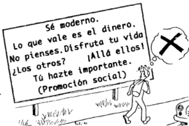
CAER EN LOS GANCHOS DE LA PROPAGANDA