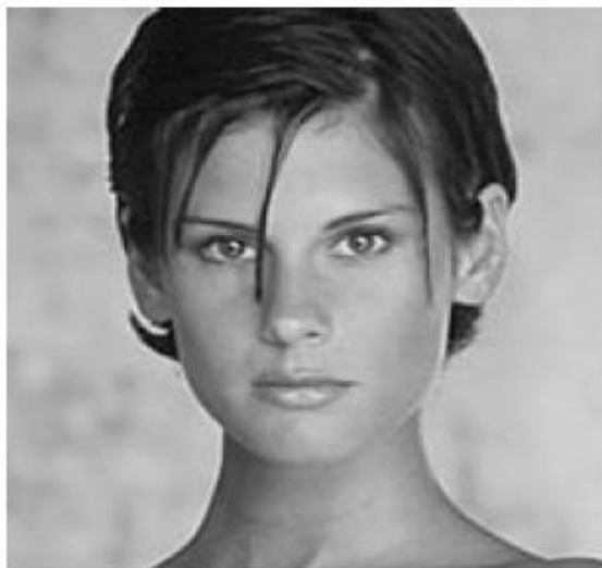
CONVERTIRSE EN MUÑECA