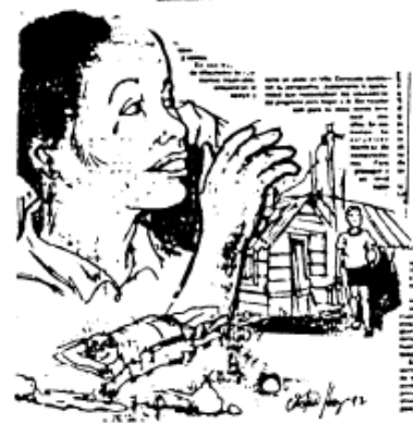
ATRAPADOS POR LOS VICIOS drogas + alcohol + juego + haraganería...