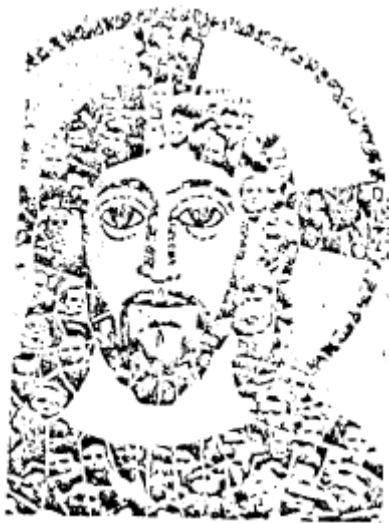
Nuevo rostro de Jesús (I Cor 12,12)

Somos un pueblo que camina y juntos caminando podremos alcanzar otra ciudad que no se acaba sin penas ni tristezas, ciudad de eternidad